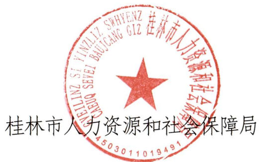
桂林市人力资源和社会保障局