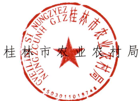
桂林市农业农村局