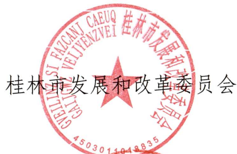
桂林市发展和改革委员会