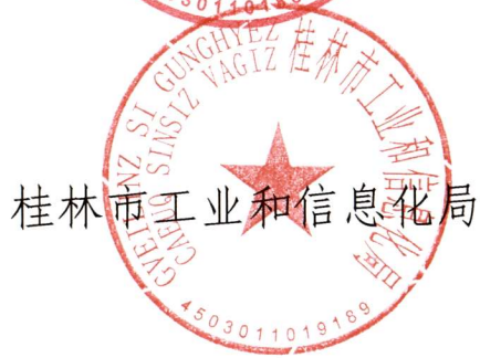
桂林市工业和信息化局